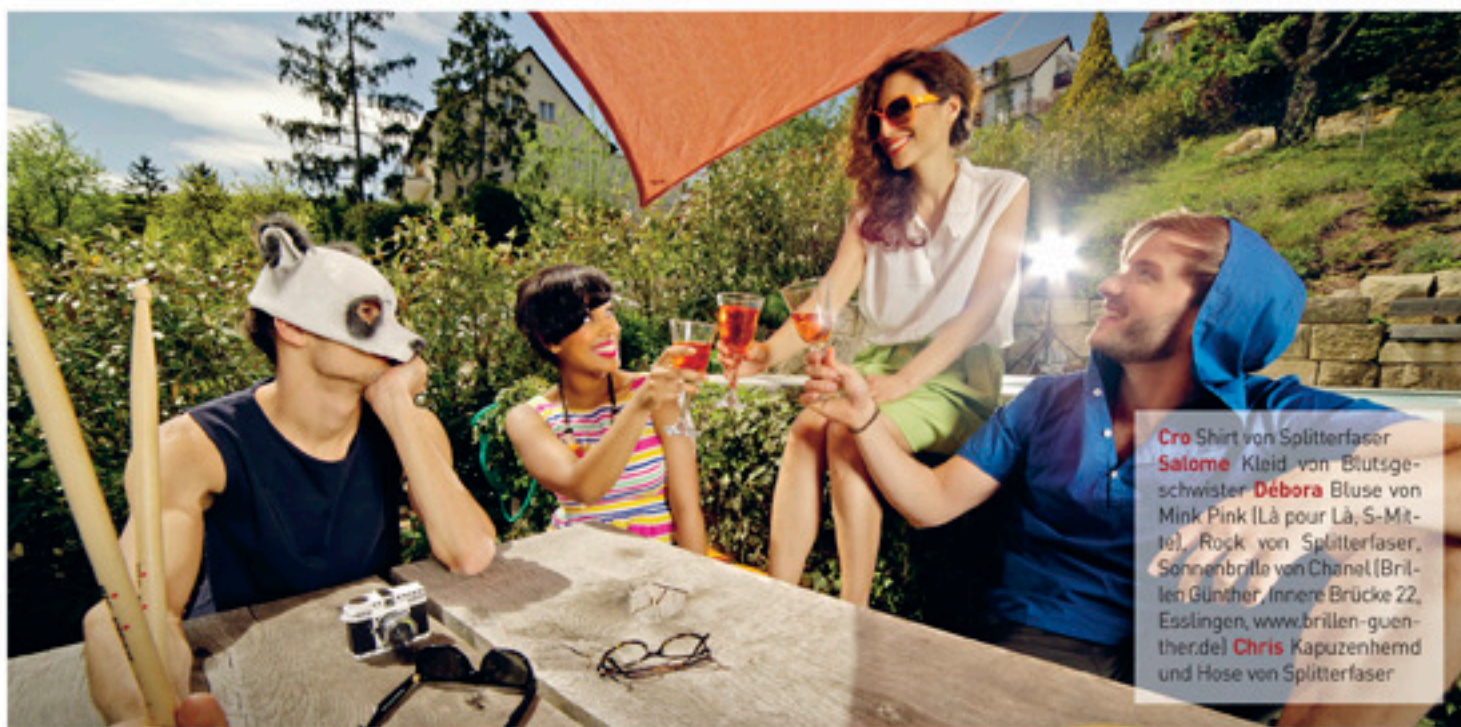
Cro Shirt von Splitterfaser Salome Kleid von Blutsge- schwister Débora Bluse von Mink Pink (Là pour Là, S-Mit- Je), Rock von Splitterfaser, Sonnenbrille von Chanel (Bril- len Günther, Innere Brücke 22, Esslingen, www.brillen-guen- ther.de) Chris Kapuzenhemd und Hose von Splitterfaser