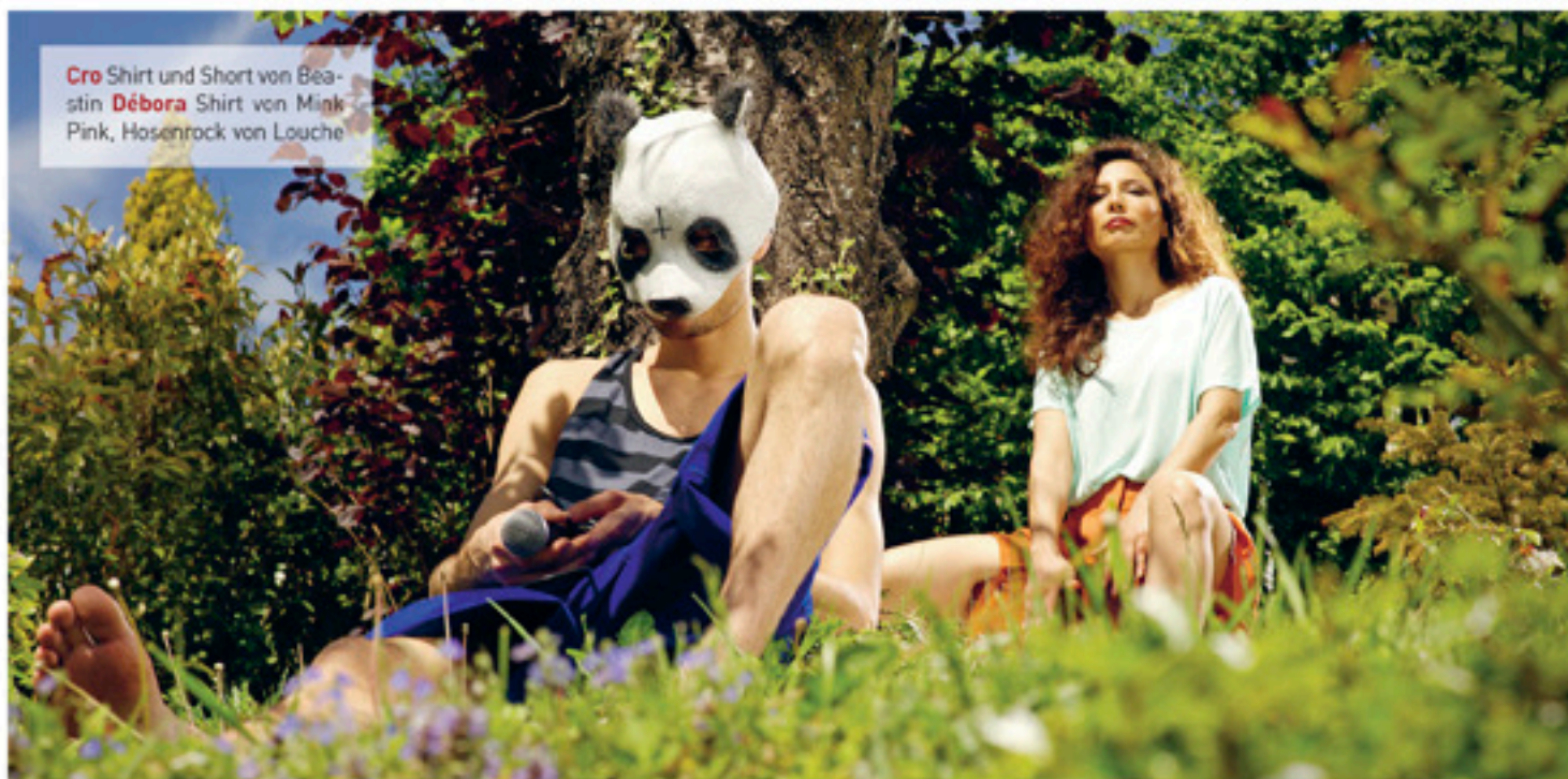
Cro Shirt und Short von Beas- stin Débora Shirt von Mink Pink, Hosentrock von Louche